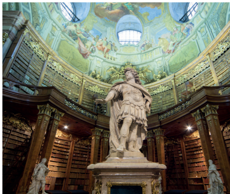
Prunksaal der Österreichischen Nationalbibliothek

DAS BESONDERE OBJEKT Ausstellung und Vorträge