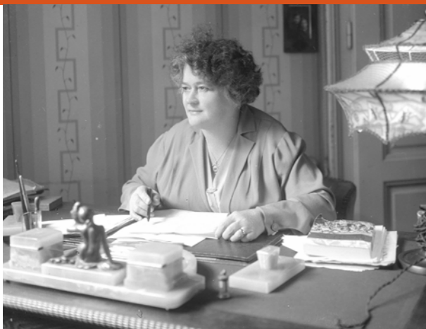
Adelheid Popp, 1930