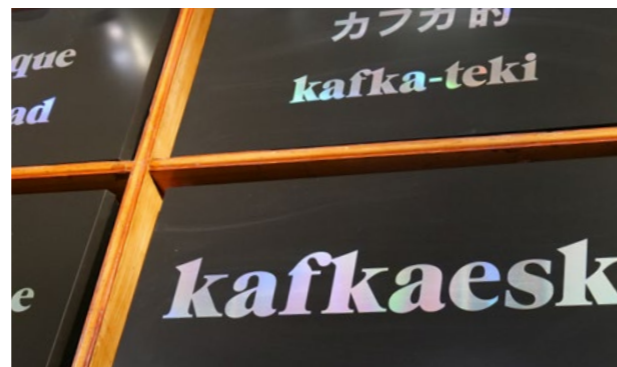
Kafkaesk in vielen Sprachen. Literaturmuseum der ÖNB