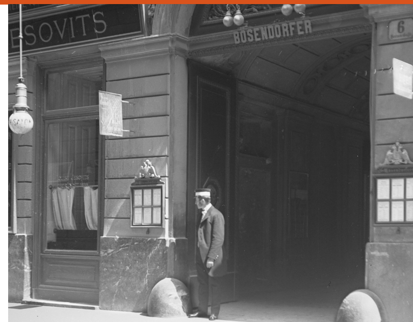
Herrengasse 6, Palais Liechtenstein, Durchgang zum Bösendorfersaal, 1913

Ludwig Bösendorfer (1835–1919), der Sohn des Klavierbauers Ignaz Bösendorfer, trat nach einer Ausbildung am Wiener Polytechnischen Institut in den väterlichen Betrieb ein. Nach dem Tod seines Vaters 1859 übernahm er die Leitung der neuen Fabrik vor dem Schottentor; im selben Jahr führte er eine Änderung der „Wiener Klaviermechanik“ ein, mit der eine höhere Anfangsgeschwindigkeit am Hammerkopf erreicht wurde. Seine Erzeugnisse zeigte Bösendorfer mit großem Erfolg auf mehreren Weltausstellungen. Er galt seither als bester Klavierfabrikant Österreichs und belieferte nicht nur den österreichischen Hof in Wien, sondern auch den russischen Zaren und den japanischen Meiji-Kaiserhof. 1871 bezog er eine größere Produktionsstätte und verlegte den Verkauf in das damalige Palais Liechtenstein in der Herrengasse, dessen Reitschule er in den Bösendorfersaal umwandelte. Hier spielten zahlreiche Künstler auf Bösendorfer-Flügeln.