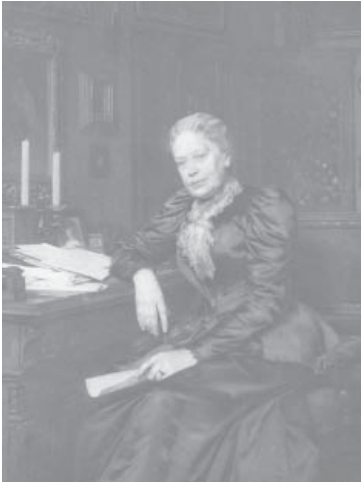
Abb. 4 (links): Marie von Ebner Eschenbach, gezeichnet von Julius Schmidt