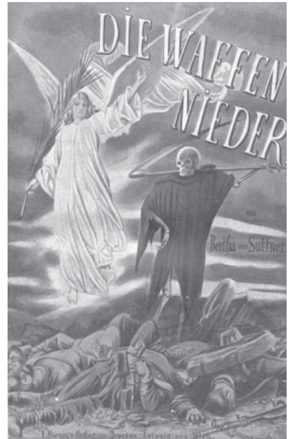
Abb. 1: Buchcover der Volksausgabe von Bertha von Suttners Die Waffen nieder , Dresden: Piersons Verlag, 1896

Literarische Bestseller österreichischer Autorinnen vom 19. Jahrhundert bis zum Zweiten Weltkrieg