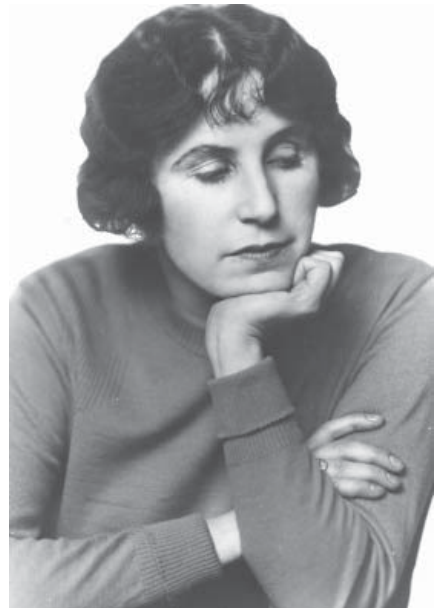
Abb. 11 und 12: Photographien von Paula Grogger (links) und Gina Kaus (rechts)

indem sie kleine Geschichten unter verschiedenen Pseudonymen publiziert. Die Ehe wurde geschieden, Vicki Baum ging nach Darmstadt, arbeitete als Harfenistin und heiratete 1916 den Dirigenten Richard Lert. Sie gab ihre Musikerinnen-Karriere auf und arbeitete von da an literarisch und journalistisch. 1926 trat sie eine Stelle als Redakteurin beim renommierten Ullstein-Verlag in Berlin an – ein Schritt, der ihre Schriftstellerinnen-Karriere begründen wird 57 .