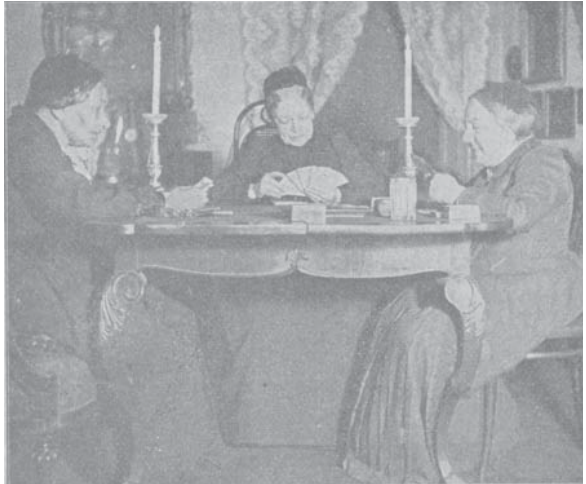
Abb. 5 (rechts): Tarokrunde mit Betty Paoli, Marie von Ebner Eschenbach und Ida Fleischl

werden. Konträr dazu fanden ihre autobiographischen „Übungen“, wie z.B. Bei meinen Landsleuten , Schattenleben , Aus Rom an meine Freunde , Meine Erinnerungen an Grillparzer , Aus einem zeitlosen Tagebuch und ihr vergessenes, dramatisches Werk (z.B. Maria Stuart ) bisher nur wenig Beachtung in der Frauenforschung 19 .