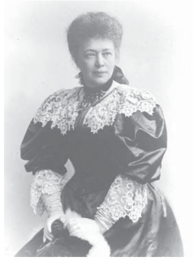
Abb. 6: Bertha von Suttner, 1903, Photographie von C. Pietzner, k.u.k.-Hofatelier (ÖNB, Bildarchiv, NB 502819-B)

erfolgte der Erstdruck in zwei Bänden bei Pierson in Dresden, obwohl zahlreiche andere Verlage eine Drucklegung aus politischen Gründen abgelehnt hatten. „Die Konflikte in Geschichte und Gegenwart wurden für das Buch sorgfältig recherchiert, um vor den Schrecken des Krieges zu warnen“, so eine zeitgenössische Rezension 25 .