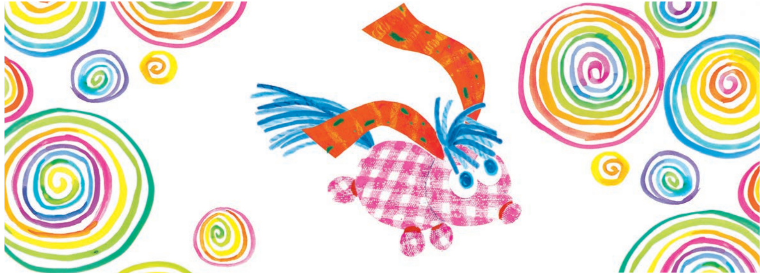
Aus: Mira Lobe/Susi Weigel: Das kleine Ich bin ich, © 1972 by Verlag Jungbrunnen Wien