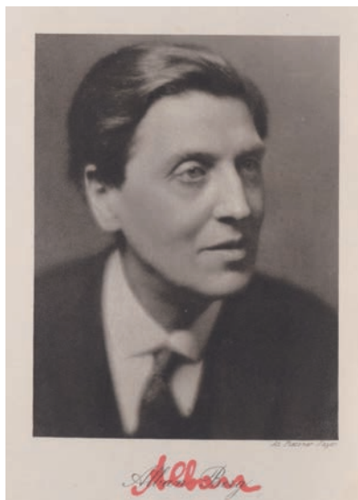
Titelblatt „Lyrische Suite“, 1927 (ÖNB/Musiksammlung F21.Berg.3437)

Der künstlerische Nachlass Alban Bergs ist einer der umfangreichsten und wichtigsten der Musiksammlung der Österreichischen Nationalbibliothek. Er wurde der Bibliothek von Bergs Witwe Helene testamentarisch vermacht und 1977 übergeben. 2015 gedenkt die Musikwelt des 130. Geburtstags und des 80. Todesjahres Alban Bergs – Grund genug, das Schaffen des großen Komponisten in einigen charakteristischen Aspekten zu beleuchten. Ein Schlüsselwerk Bergs, die „Lyrische Suite“ für Streichquartett, wird vorgestellt; sie verdankt ihre Entstehung der Beziehung des Komponisten zu Hanna Fuchs-Robettin, der Schwester Franz Werfels. In ein Handexemplar der Partitur trug Berg minutiös die Erläuterungen ein, die dieses Werk zum musikalischen Denkmal einer großen Liebe machen. Das Autograf der „Lyrischen Suite“ und das annotierte Handexemplar werden an diesem Abend gezeigt.