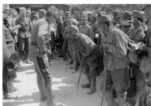
Kaiser Karl I. in der 11. Isonzoschlacht

1915 haubitze.jpg