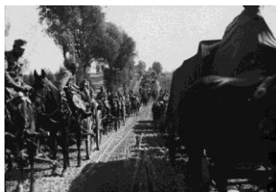
Vormarsch österreichisch-ungarischer Truppen in Galizien

Foto: Franz Pachleitner 1915 vormarsch.jpg