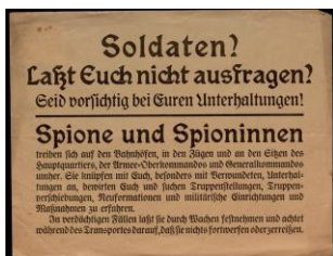
„Soldaten! Lasst Euch nicht ausfragen!“

18.6.1918 piave_damm.jpg