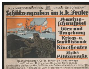
„Schützengraben im k. k. Prater“

Kundmachung Wien (vermutlich), 1914/1918 kundmachung.jpg