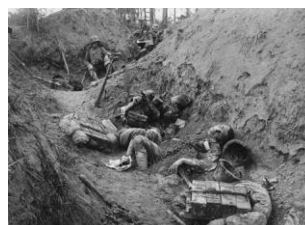
In der feindlichen Stellung am Piave-Damm, Italien

22.8.1917 isonzoschlacht.jpg