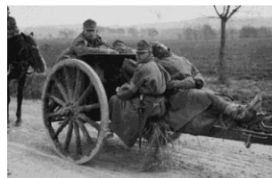
Auf einer Haubitze sich ausruhende Soldaten der k. u. k. Armee