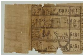
Gefilde des Jenseits

Detail aus dem Totenbuch der „Taruma“ Papyrus