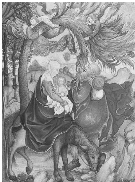
Flucht nach Ägypten Gebetbuch für Johann II. von Pfalz-Simmern Nürnberg, 1535