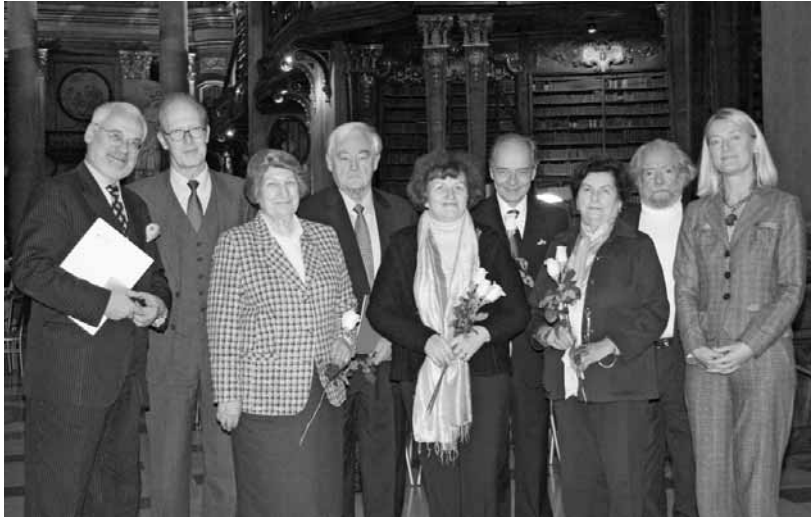
Festakt im Prunksaal anlässlich der 5.000. Buchpatenschaft.