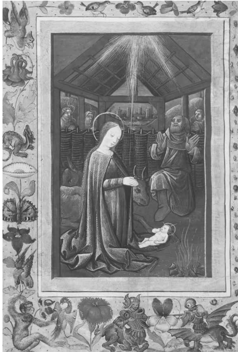
Christi Geburt Stundenbuch Rouen, um 1500