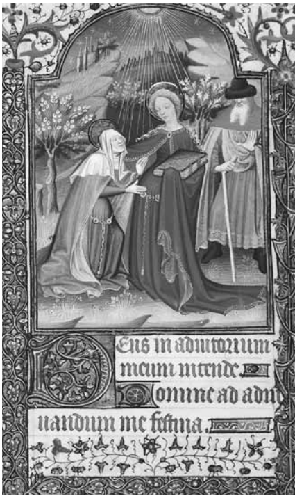
Heimsuchung Mariens Stundenbuch Paris, um 1430