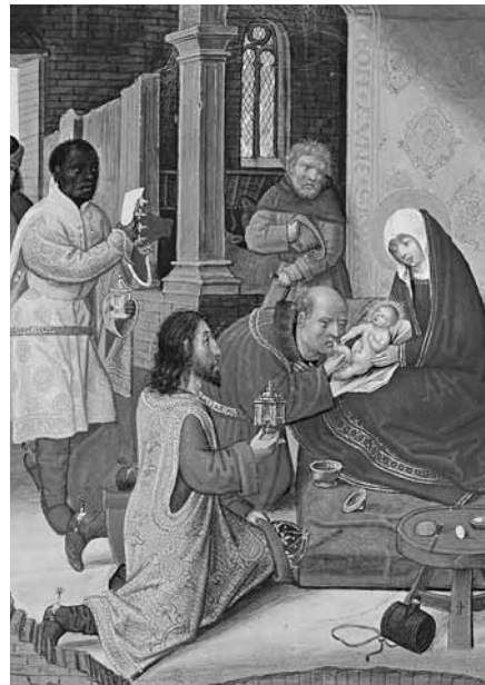
Erscheinung des Herrn (Epiphanie) Hortulus animae Flandern, 1510/1524

ten. Tatsächlich liefert dieses Zeitalter in vielfacher Hinsicht die Grundlagen für unser Verständnis vom Weihnachtsfest. Auf den in ihrem erzählerischen Gehalt oft kargen evangelischen Berichten aufbauend, werden die Ereignisse in dieser Zeit mit einer Fülle von inhaltlichen, zum Teil legendenhaften Erweiterungen bereichert.