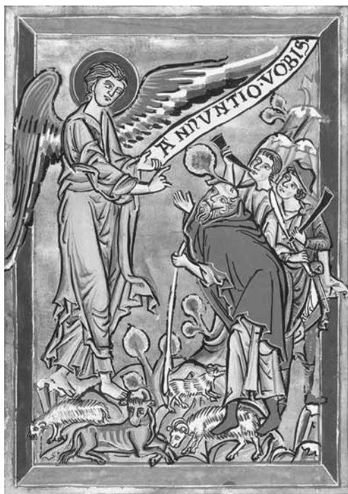
Verkündigung an die Hirten Evangelistar Niedersachsen, um 1240/50