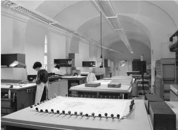
Blick in die Papierrestaurierung nach der Sanierung