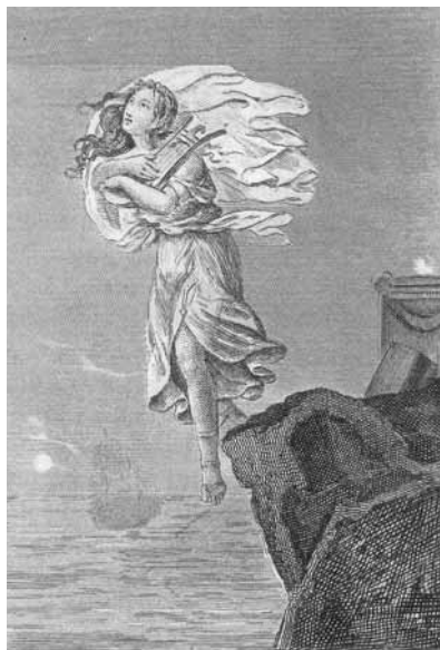
Sappho s'élançant du Rocher de Leucade dans la Mer.

Sappho s'élançant du Rocher de Leucade dans la Mer